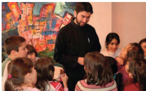
Κορυφαία ΜΚΟ στην Ελλάδα για το 2016 αναδείχθηκε η «Κιβωτός του Κόσμου».