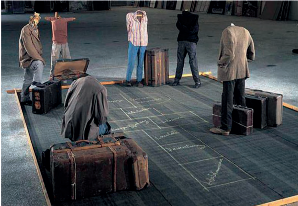
Βλάσης Κανιάρης, Το κουτσό, Περιβάλλον, ΕΜΣΤ, Αθήνα, 1974.