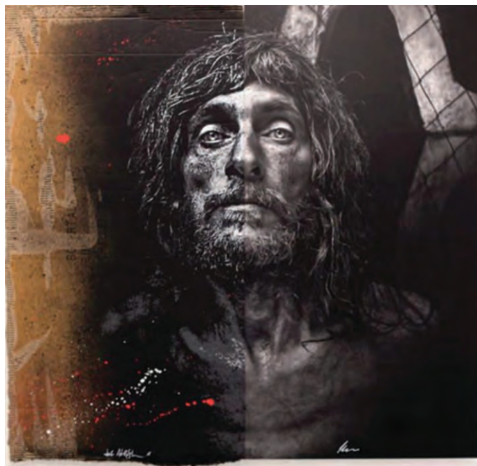
Μια εικαστική «συνέργεια» του Γάλλου λιθογράφου Jef Aérosol και του Άγγλου φωτογράφου Lee Jeffries, από τη σειρά «Synergy». Χωρίς τίτλο #3, φωτογράφιση του Éric Simon. Ο Lee Jeffries φωτογραφίζει πορτρέτα άστεγων ανθρώπων.